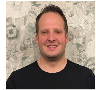
Catering Wolfgang Erl